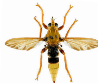
Asile frelon, Asilus crabroniformis