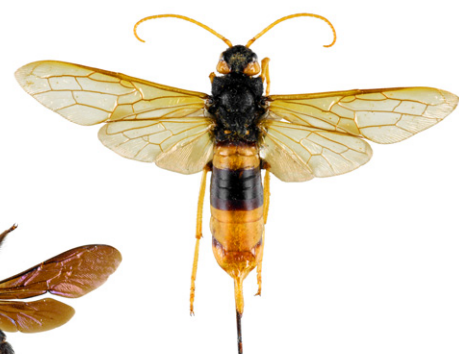
Sirex géant, Urocerus gigas

Le sirex géant est un Hyménoptère dont la larve se nourrit de bois. La femelle peut atteindre 4,5 cm, a une coloration proche du frelon asiatique, mais s'en distingue facilement par des antennes longues entièrement jaunes ainsi que par la présence d'une longue tarière lui permettant de pondre dans le bois. Cet insecte est inoffensif.