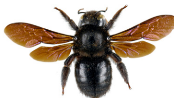
Xylocope ou abeille charpentière, Xylocopa violacea

L' abeille charpentière mesure entre 2 et 3 cm. C'est l'une des plus grandes abeilles européennes. Elle est entièrement noire avec des reflets bleu violacés. Elle construit son nid dans le bois mort et nourrit ses larves de pollen.