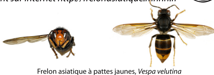
Frelon asiatique à pattes jaunes, Vespa velutina

Le frelon asiatique à pattes jaunes, Vespa velutina , est à dominante noire, avec une large bande orange sur l'abdomen et un liseré jaune sur le premier segment. Sa tête vue de face est orange, et les pattes sont jaunes aux extrémités. Il mesure entre 17 et 32mm.