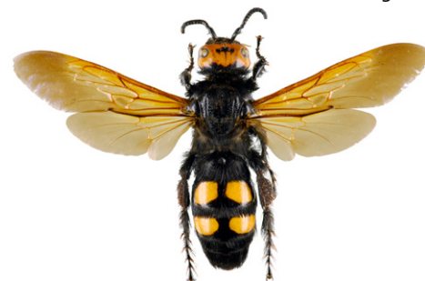
Scolie des jardins, Megascolia maculata flavifrons

La scolie des jardins fait partie des plus imposantes "guêpes" européennes. Elle est de ce fait fréquemment confondue avec le frelon asiatique. Sa pilosité est très épaisse. Son corps est noir brillant, sa tête est jaune sur le dessus et elle possède 4 zones jaunes et glabres sur l'abdomen. C'est un parasite de larves de gros Coléoptères (comme le Hanneton).