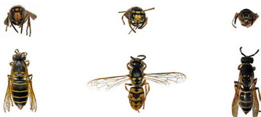
Guêpe des buissons, Dolichovespula media

Les guêpes sont plus petites que les frelons. Les ouvrières mesurent environ 15mm en fin d'été. Attention, une reine de guêpe peut dépasser légèrement 20mm, c'est-à-dire la taille du frelon asiatique représenté ici sans la tête. Au printemps les guêpes peuvent donc être plus grande que les premières ouvrières de frelon.